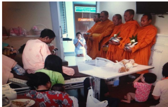
กิจกรรม Service Mind ผู้ป่วย