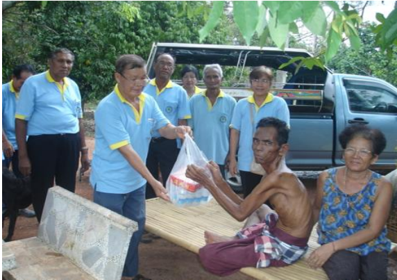
บทบาทของภาคี : ชมรมผู้สูงอายุ