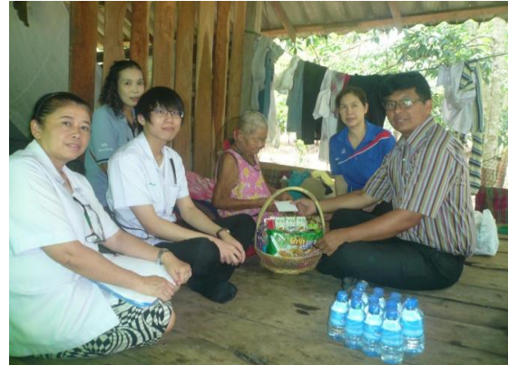
บทบาทของภาคี : นายก อบต.