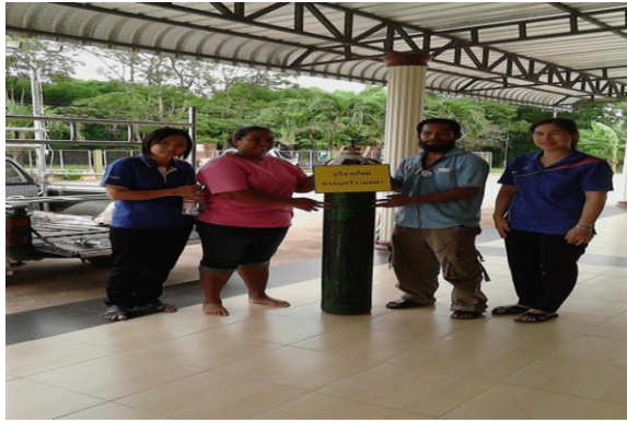
การจัดหาอุปกรณ์ที่จำเป็นแก่ผู้ป่วยในชุมชน