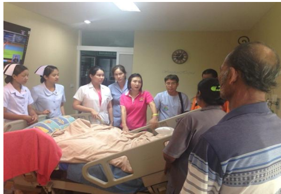
การดูแลผู้ป่วยของทีมสาขาชีพ รพ.วังจันทร์

ผลการดำเนินงาน พบว่า ร้อยละ 92.10 ของแกนนำสุขภาพ มีทักษะในการดูแลผู้ป่วยอย่างถูกต้อง ร้อยละ 93.93 ของญาติผู้ป่วย มีทักษะในการดูแลผู้ป่วยอย่างถูกต้อง ร้อยละ 100 ของผู้ป่วยกลุ่มเป้าหมาย ได้รับการดูแลตามมาตรฐานของการดูแลผู้ป่วยระยะสุดท้าย และ ได้รับการดูแลตามความต้องการที่จำเป็นของผู้ป่วย และญาติ ร้อยละ 74.70 ของผู้ป่วยระยะสุดท้าย มีผลการประเมินคุณภาพชีวิตที่ดีขึ้น ร้อยละ 93.50 ของผู้ป่วยและญาติมีความพึงพอใจต่อการจัดกิจกรรมของทีมสุขภาพและชุมชน มีการสร้างแนวทางการดูแลผู้ป่วยที่เชื่อมโยงกันระหว่าง รพ.วังจันทร์ รพ.สต.บ้านวังจันทร์และชุมชน มีการสร้างการมีส่วนร่วมของภาคีเครือข่าย ในการพัฒนาระบบการดูแลผู้ป่วยระยะสุดท้ายในชุมชน เช่น มีการสนับสนุนจากกองทุนตำบล การสร้างแกนนำสุขภาพ การปรับสิ่งแวดล้อมจาก อบต. การมีส่วนร่วมของวัด/อสม./ชมรมผู้สูงอายุ การ HHC โดยผู้นำชุมชน เป็นต้น