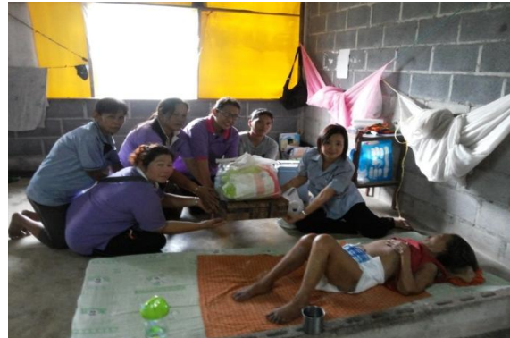
ชุมชน ช่วยผู้ป่วย