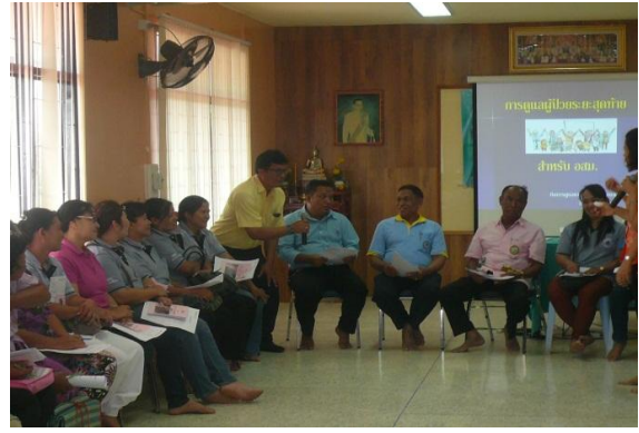
การสร้างแกนนำ Palliative Care