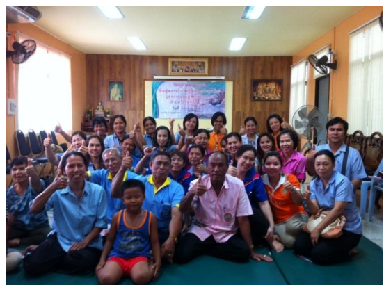
การสร้างแกนนำนักบริบาลชุมชน