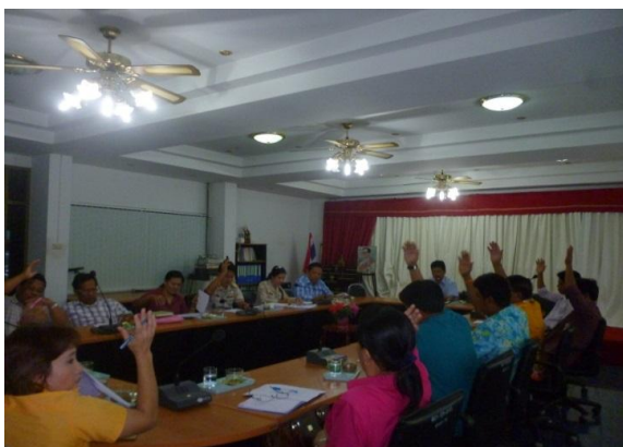
การประชุมคณะกรรมการ ODOP : Palliative Care

การดำเนินงานตามประเด็น ODOP ตำบลวังจันทร์ ได้มีการกำหนดกิจกรรมร่วมกันของคณะกรรมการ ODOP : ผู้ป่วยระยะสุดท้าย โดยมีการจัดทำแผนที่ทางเดินยุทธศาสตร์ จัดทำแผนสุขภาพตำบลและโครงการเพื่อขอสนับสนุนงบประมาณจากกองทุนสุขภาพตำบล มีการจัดตั้งทีมนักบริบาลชุมชนมีการสร้างหลักสูตรชุมชนในการดูแลผู้ป่วยระยะสุดท้าย พร้อมกับการอบรมทีมสุขภาพ เพื่อให้มีทักษะในการดูแลและฟื้นฟูสมรรถภาพให้ผู้ป่วย กลุ่มเป้าหมาย มีการกำหนดกิจกรรมหรือบริการที่จำเป็น ทั้งกิจกรรมด้านการดูแลทางกายและกิจกรรมในกลุ่ม Service Mind ตอบสนองความต้องการของผู้ป่วย กำหนดบทบาทหน้าที่การดูแลผู้ป่วยขององค์กรหรือภาคีต่างๆ เช่น บทบาทของผู้นำชุมชน อบต. อสม. แกนนำนักบริบาลชุมชน ชมรมผู้สูงอายุ กลุ่มสตรีแม่บ้าน เป็นต้น รวมทั้งการจัดกิจกรรมจัดเวทีแลกเปลี่ยนเรียนรู้เพื่อค้นหาแนวทางในการดำเนินงานแบบมีส่วนร่วม