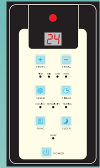
แผงควบคุมที่ตัวเครื่อง