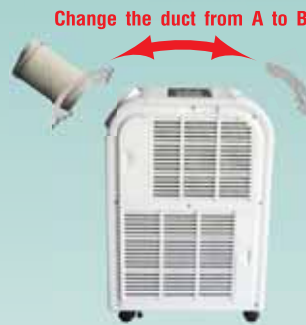
สลับเปลี่ยนปลอกท่อ Duct