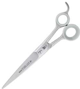
กรรไกรตรง

ประเภทของกรรไกรจะแบ่งออกเป็น 3 กลุ่มด้วยกันคือ กรรไกรตรง, กรรไกรโค้ง และกรรไกรซอย