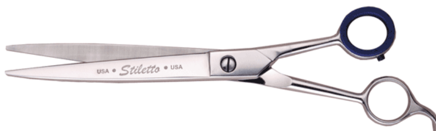
ลักษณะกรรไกรแบบ Short Shank

Short Shank จะเป็นลักษณะของกรรไกรที่มีความยาวของตรงตามกรรไกรสั้นกว่าความยาวของใบกรรไกร ซึ่งจะส่งผลให้กรรไกรกางออกได้มากขึ้น ตัดได้รวดเร็วขึ้น และลดการเมื่อยล้าของข้อมือช่างตัดขนสุนัข เหมาะสำหรับช่างตัดขนสุนัขที่มีปัญหาบริเวณข้อมือ