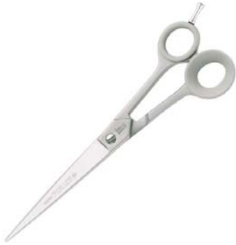
กรรไกรที่มีลักษณะไบกรรไกรแคบ

กรรไกรตรงที่มีขายอยู่ในท้องตลาดจะมีอยู่ 2 รูปแบบด้วยกันคือ ไบกรรไกรแคบ และไบกรรไกรกว้าง กรรไกรตรงส่วนใหญ่จะมีขนาดตั้งแต่ 4"-10"