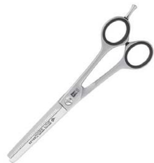
กรรไกรซอย