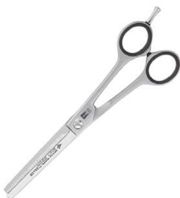
กรรไกรซอยด้านเดียว

ปัจจุบันมีผู้ผลิตหลายเจ้าเหมือนกันที่ผลิตกรรไกรซอยออกมาที่มีฟันซี่ๆ 2 ด้าน อาทิเช่น Witte, Heritage ซึ่งฟันซี่ 2 ด้านนี้จะช่วยทำให้ขนสุนัขดู soft และเป็นธรรมชาติมากกว่ากรรไกรซอยด้านเดียว จะเหมาะกับการตัดขนสุนัขที่ขนละเอียดและบาง ไม่เหมาะกับการตัดขนสุนัขหนาๆ เพราะจะทำให้กรรไกรตัดขนสุนัขไม่เข้า