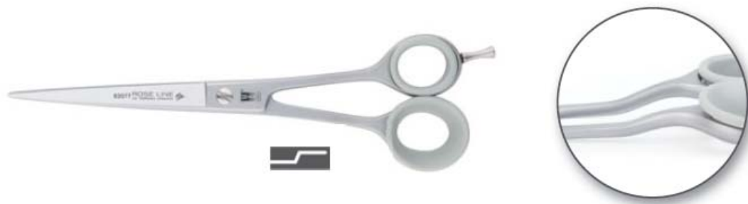
ลักษณะกรรไกรแบบ Bent Shank

Bent Shank หรือ Offset Shank จะเป็นลักษณะของกรรไกรที่มีรูปทรงตรงตามกรรไกรโค้งงอ เป็นชิ้นขนานกับใบกรรไกร เพื่อให้มือของช่างตัดขนสุนัขอยู่นอกริเวณที่ตัดขนสุนัข