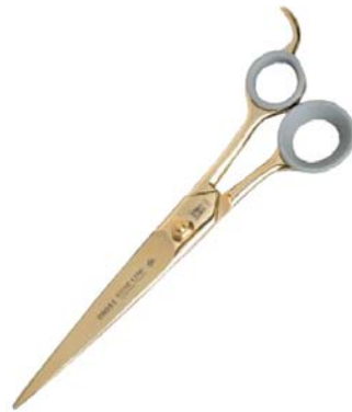
กรรไกรที่มีลักษณะไบกรรไกรกว้าง

กรรไกรตรงที่มีลักษณะไบกรรไกรแคบ จะเหมาะกับการตัดขนสุนัขที่มีลักษณะขนละเอียด เส้นเล็ก และเบา ได้แก่ สุนัขพันธุ์ Bichon, Lhasa และ Poodle กรรไกรลักษณะแบบนี้จะมีขนาดตั้งแต่ 4"-10"