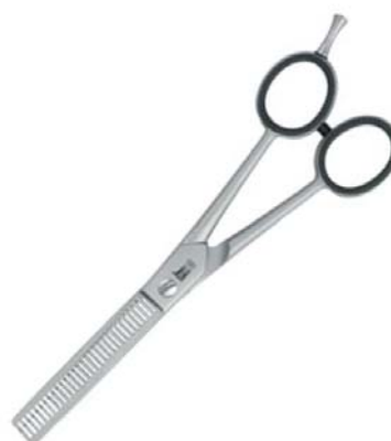
กรรไกรซอยสองด้าน