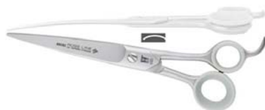
กรรไกรโค้ง