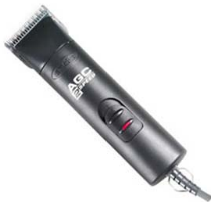
Andis AGC 2 Speed (220V)

เพื่อที่จะได้เห็นภาพและเข้าใจโครงสร้างของปัตตาเลี่ยนมากขึ้น ดังนั้นผมจะเลือกปัตตาเลี่ยน Andis รุ่น AGC 2 Speed (220V) ที่เป็นรุ่นยอดนิยมมาประกอบการอธิบายครับ