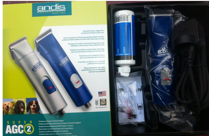
#23920 - Andis Ultra-Edge Super 2-Speed Clipper- Blue

ผมขอออกนิตหนึ่งนะครับ ผมเข้าใจว่ามีผู้อ่านหลายท่านสงสัยว่าปลั๊กตาเลียนสีฟ้าที่ใช้ไฟ 110V กับไฟ 230V แตกต่างกันยังไง ผมเคยเขียนลงในนิตยสารโลกสัตว์เลี้ยงฉบับที่ 178 หรือท่านจะเข้าไปดูที่เว็บของ MaMa Grooming Shop ก็ได้ครับ ในแถบเมนู “แหล่งความรู้”