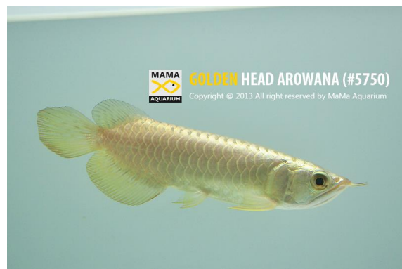
ตัวอย่างปลามังกรทอง (Golden Head Arowana)