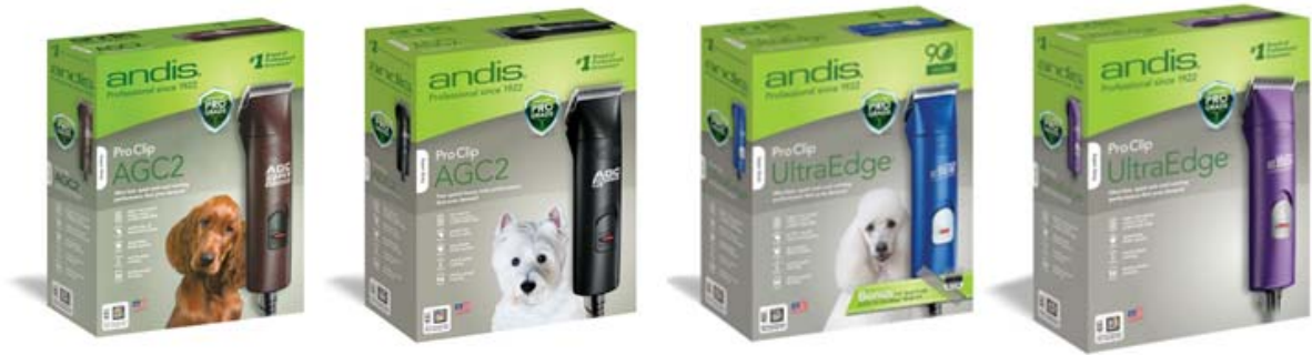
ปัตตาเลี่ยน Andis ที่ใช้แรงดันไฟฟ้า 110V (Package ใหม่)

ส่วนกล่องใส่ปัตตาเลี่ยนใหม่นั้นจะดูดีขึ้น น่าใช้มากขึ้น กล่องใหม่จะถูกผลิตเพื่อฉลองครบรอบ 90 ปี ของบริษัท Andis เมื่อปีที่ผ่านมา แต่ที่น่าแปลกใจก็คือ ทาง Andis มีการออกแบบกล่องใหม่เพื่อใช้แบ่งแยกระหว่างปัตตาเลี่ยนที่ใช้แรงดันไฟฟ้า 110V หรือ 230V ซึ่งในส่วนของปัตตาเลี่ยนที่ใช้แรงดันไฟฟ้า 110V จะมีสองสีที่เพิ่มเข้ามาคือ สีชมพูกับสีม่วง ส่วนของปัตตาเลี่ยนที่ใช้แรงดันไฟฟ้า 230V ผมเคยเห็นแค่เพียง 4 สีเท่านั้นคือ ดำ แดง น้ำเงิน เทา