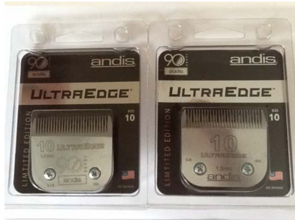
ใบมีด Andis (Package ใหม่)