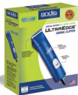
ปัดตาเลี่ยน Andis (Package เก่า)