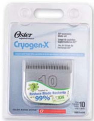
ใบมีด Oster (Package เก่า)

ใบมีดปัตตาเลี่ยน Oster ก็ได้มีการปรับเปลี่ยน package ใหม่หมด ใช้สีเขียวที่ดูสดใสมากขึ้น แต่คุณภาพยังเหมือนเดิม น่าจะเปลี่ยนมาได้สักพักหนึ่งแล้วครับ น่าจะประมาณปีหนึ่งได้