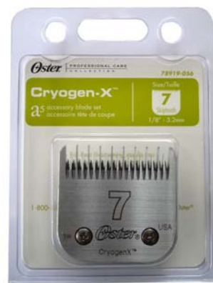
ใบมีด Oster (Package ใหม่)