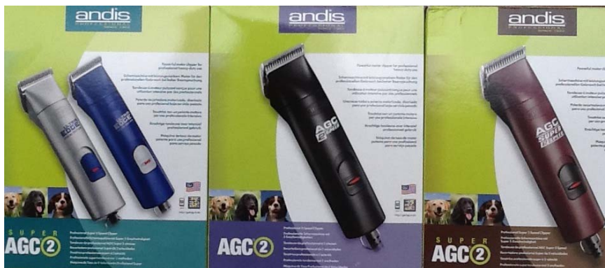
ปัตตาเลี่ยน Andis ที่ใช้แรงดันไฟฟ้า 230V (Package ใหม่)