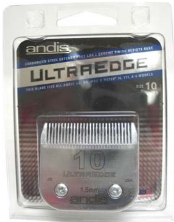
ใบมีด Andis (Package เก่า)