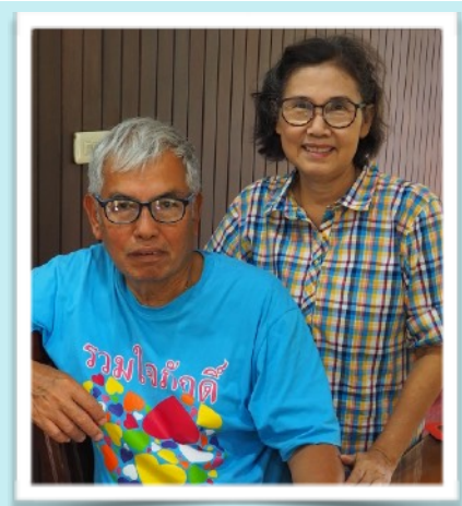
คุณสมพิศและสามีคู่ชีวิต สิงหาคม 2561