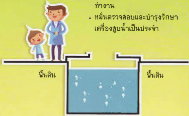
บ่อพักน้ำ